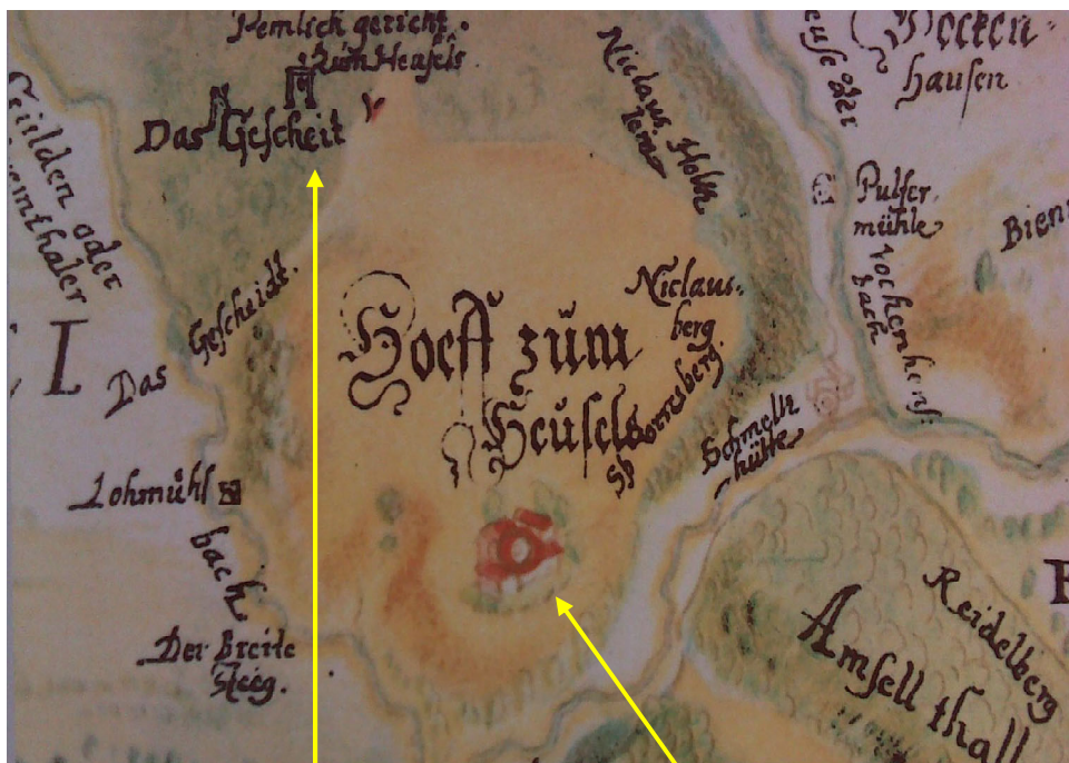
Die Richtstätte (oben) und der Hof Häusel (unten) auf einer Karte (Ausschnitt) von Wilhelm Dilich, 1607/09

An der S-Bahn-Station in Eppstein werden die Autos geparkt und los geht es zunächst ein kleines Stück am Daisbach unterhalb der Bahnlinie entlang. Die Straße nach Bremthal wird überquert und wir wandern aufwärts Richtung Hof Häusel. Schon bald ist die erste Anhöhe erreicht, der Weg verläuft zwischen den Pferdekoppeln in Richtung eines kleinen Waldes. Hier finden wir eine Hinweistafel auf die Richtstätte Häusel und weiter geht es durch den Wald. Bald schon liegt der Wald wieder hinter uns und wir laufen durch Felder und Wiesen mit Blick auf Eppenhain, kurze Zeit über einen etwas holprigen Weg in Richtung Wald, über welchem wir Ehlhalten erreichen. Wir durchqueren den Ort und wenden uns dem Silberbachtal zu. Schon nach kurzem Weg geht es wieder steil bergan, zunächst durch Wald und dann durch die Streuobstwiesen von Eppenhain. Von hier aus können wir nun zurückschauen auf den Weg von Hof Häusel Richtung Ehlhalten. In Eppenhain kehren wir im Haus Rossert zum Mittagessen ein (wer schon im März 2009 mitgewandert ist, weiß, wie gut es dort schmeckt). Nach dem Mittagessen geht es noch ein Stück durch Eppenhain und zum Rossert mit seinem schönen Aussichtspunkt „Eppoblick“ (auch diesen kennen die Märzwanderer 2009). Und ab jetzt geht es nur noch durch den Wald bergab, an der „Heimlichen Wiese“ vorbei zum Wellbachtal mit einem kleinen See. Der Wellbach begleitet uns bis Eppstein. Nun noch ein Stück durch den Ort und wir haben die Autos wieder erreicht.