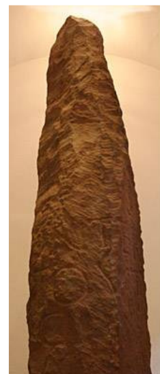
Toutonenstein im Museum in Miltenberg

Die Toutonen werden als Teilstamm der Helvetier gezählt und gehörten somit eigentlich zu den Stämmen der Kelten. Die Helvetier waren ein keltischer Volksstamm aus Süddeutschland und der Nordschweiz, der seit dem 3. vorchristlichen Jahrhundert